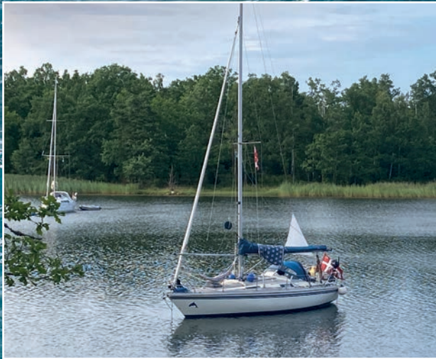
Det gode skib "Hau" for anker i vig ved Figeholm, Sverige